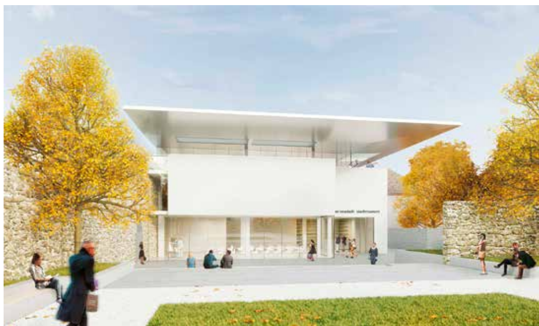
Illustration Ausstellungsort Stadtmuseum.