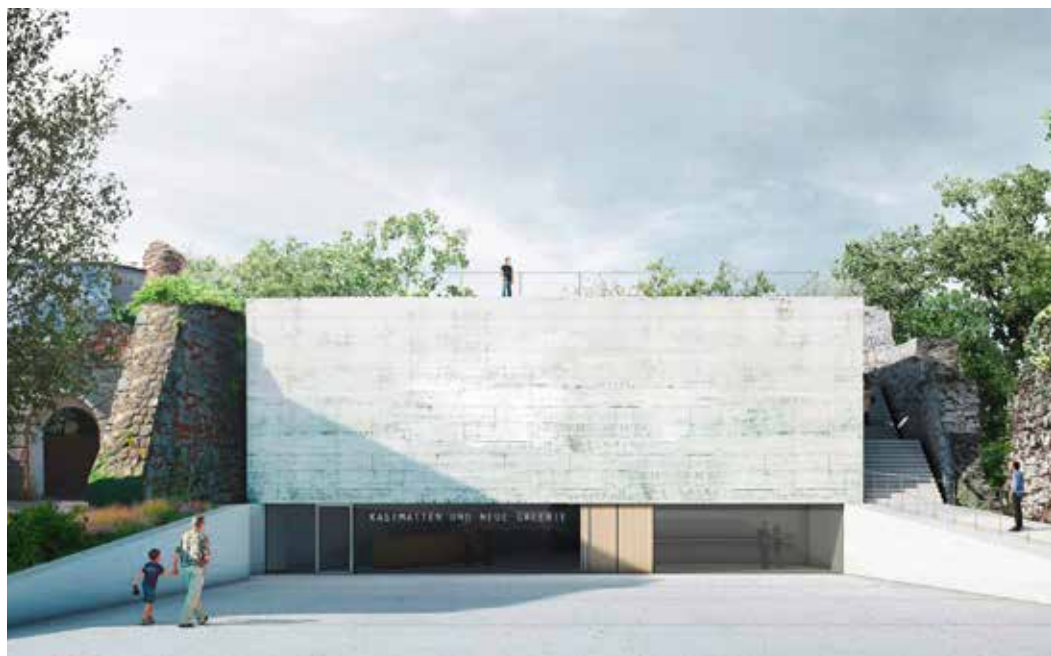
Illustration Ausstellungsort Kasematten. © NÖ Landesausstellung