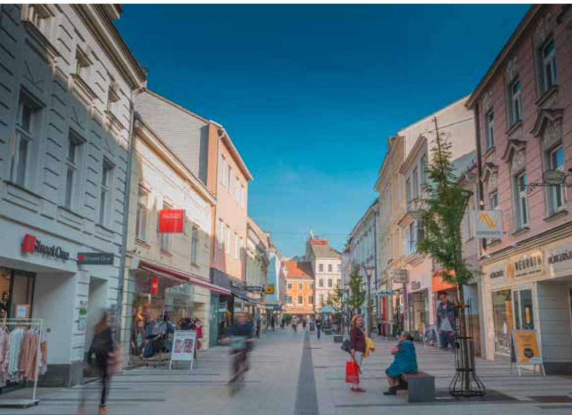
Wiener Neustadt Offensive Innenstadt.