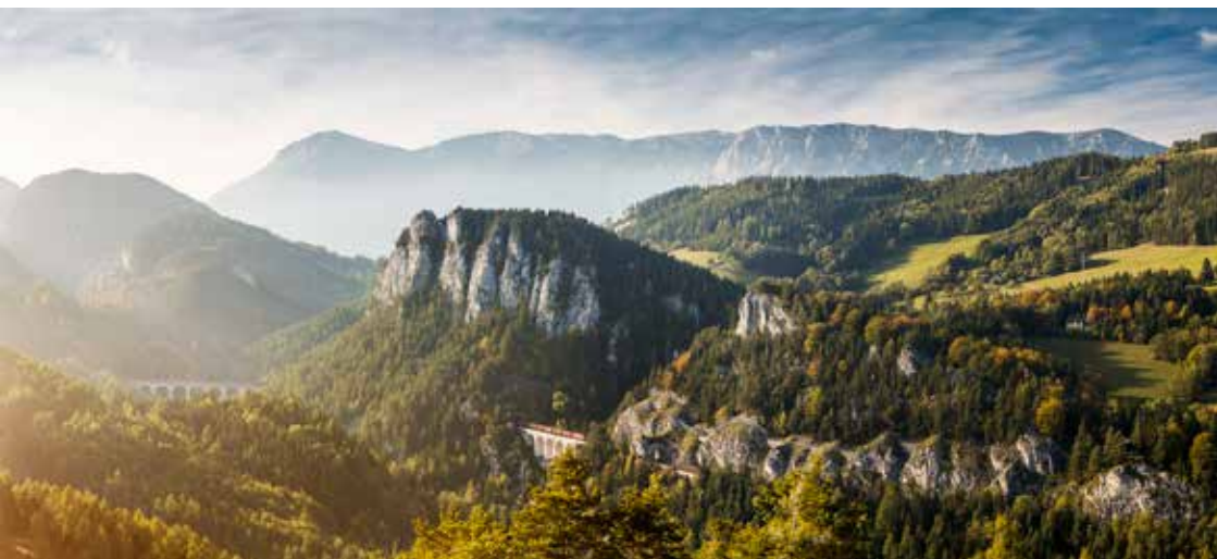
Welterbergregion Semmering-Rax.