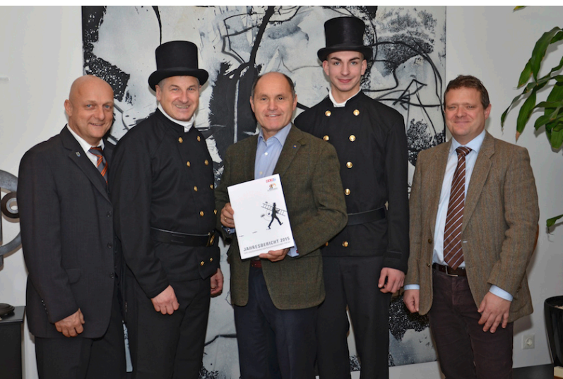
Landeshauptmann Stv. Mag. Wolfgang Sobotka