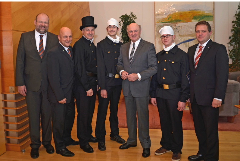
Landeshauptmann Dr. Erwin Pröll

Die besuchte Landespolitik, allen voran Landeshauptmann Dr. Erwin Pröll, sehen die NÖ-Rauchfangkehrer als sehr wichtige und unerlässliche Partner im Land Niederösterreich und freuten sich sehr über den Besuch der Glücksbringer aus Niederösterreich.